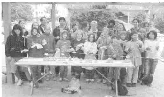
Beteiligte der Mosaik-Projektwoche freuen sich über das vom GFV gesponserte Zñüni