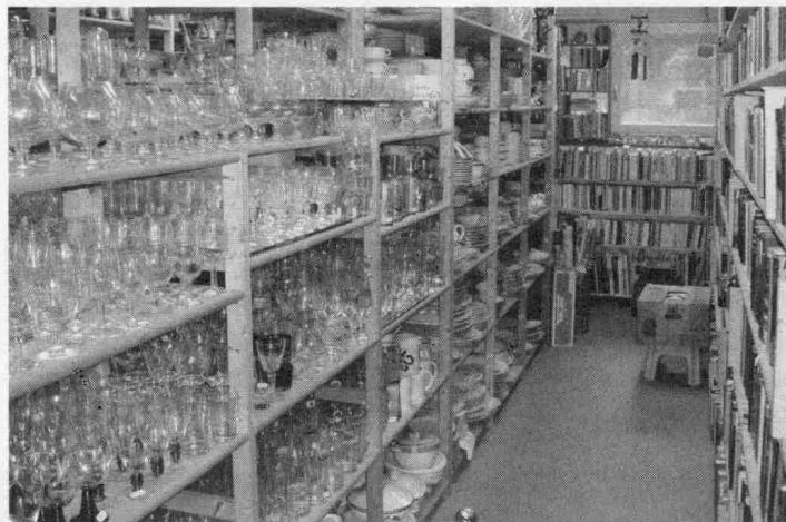
Für alle ist etwas im Brocki zu finden