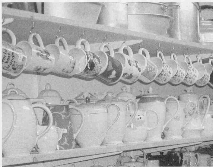
Eine Kanne oder Tasse gefällig?