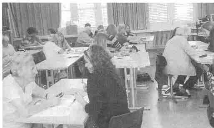
Handy-Kurs für SeniorenInnen geleitet von SchülerInnen der Bezirksschule und ihrer Lehrkraft