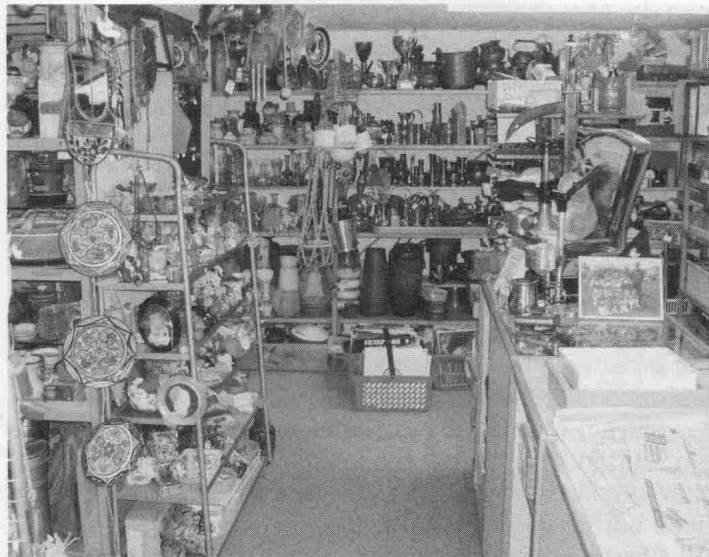
Blick in eine Ecke des Brocki